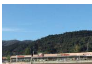
フォレストモール仙台茂庭