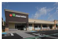
フォレストモール印西牧の原