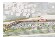
フォレストモール京田辺

● 全ての催事場は屋外にございます。● 会場のご予約はお申込み日の翌月末まで承っております。また抽選申込期間と一般申込期間を設けております。(抽選申込期間) 毎月第1月曜日から当週の金曜日までに、上述の「お問い合わせフォーム」またはお電話・メール等でお申込みください。翌週の火曜日を目的地に担当者より結果をお知らせ致します。(一般申込期間) 抽選申込期間以降、会場に空きがある場合にご予約を承らせて頂きます。● 備品(机・椅子他)は施主様にてお持ち込みください。● 備品の事前発送等の受付(現地でのお受取り・保管)は致しかねます。施設内店舗でも対応致しかねますので当日にご持参ください。● 発生したごみは全て施主様にてお持ち帰りください。● 施設内に出入している店舗で取り扱いのある商品や類似する商品を取り扱う場合は、ご出店をお断りさせて頂く場合がございます。またそれ以外の場合でも当施設に相応しくないと弊社にて判断した場合は、ご出店をお断りさせて頂く場合がございます。● 「催事出店申込書」及び「催事場使用確認書」記載事項に違反した場合、会場使用許可を取り消させていただきます。尚、使用許可取消に伴う損害等については、弊社は一切の責任を負いません。