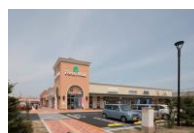
フォレストモール新前橋