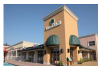
フォレストモール富士河口湖