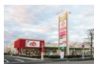
フォレストモール八王子大和田