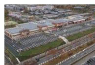
フォレストモール木津川