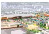
フォレストモール岩出