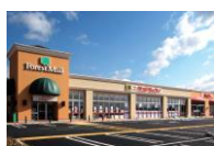
フォレストモール岡谷