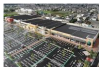
フォレストモール石岡