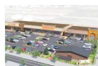
フォレストモール佐久平