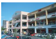
フォレストモール南大沢

全国のフォレストモールで催事スペースをご用意しております。(クリックすると各施設ホームページに移動します)